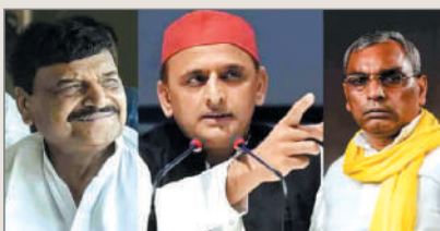
शिवपाल और राजभर को आजाद कर दिया है। समाजवादी पार्टी ने शनिवार को शिवपाल और ओपी राजभर को अलग-अलग पत्र जारी कर कहा कि अगर आपको लगता है कहीं ज्यादा सम्मान मिलेगा तो वहीं जाइए, आप जहां चाहे जाने के लिए स्वतंत्र हैं। राजभर को पत्र जारी कर सपा ने लिखा कि ओमप्रकाश राजभर समाजवादी पार्टी लगातार भारतीय जनता पार्टी के खिलाफ लड़ रही है। आपका भारतीय जनता पार्टी के साथ गठजोड़ है और लगातार भारतीय जनता पार्टी को मजबूत करने के लिए काम कर रहे हैं। अगर आपको लगता है, कहीं ज्यादा सम्मान मिलेगा तो वहां जाने के लिए आप स्वतंत्र हैं।

अखिलेश की चाचा शिवपाल और राजभर को दो टूक लखनऊ (एजेंसी)। यूपी विधानसभा चुनाव के बाद से सपा गठबंधन में पड़ी दरार बढ़ती जा रही है। राष्ट्रपति चुनाव में भी प्रतिपक्षीय समाजवादी पार्टी के प्रमुख शिवपाल सिंह यादव और सोहेलदेव भारतीय समाज पार्टी के चीफ ओमप्रकाश राजभर की क्रास वोटिंग से सपा नाराज है। समाजवादी पार्टी के राष्ट्रीय अध्यक्ष अखिलेश यादव ने अब शिवपाल और राजभर को आजाद कर दिया है। समाजवादी पार्टी ने शनिवार को शिवपाल और ओपी राजभर को अलग-अलग पत्र जारी कर कहा कि अगर आपको लगता है कहीं ज्यादा सम्मान मिलेगा तो वहीं जाइए, आप जहां चाहे जाने के लिए स्वतंत्र हैं। राजभर को पत्र जारी कर सपा ने लिखा कि ओमप्रकाश राजभर समाजवादी पार्टी लगातार भारतीय जनता पार्टी के खिलाफ लड़ रही है। आपका भारतीय जनता पार्टी के साथ गठजोड़ है और लगातार भारतीय जनता पार्टी को मजबूत करने के लिए काम कर रहे हैं। अगर आपको लगता है, कहीं ज्यादा सम्मान मिलेगा तो वहां जाने के लिए आप स्वतंत्र हैं।