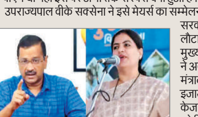
बताएंगी गुजरात का सूरत मॉडल, केजरीवाल का मामला अटका