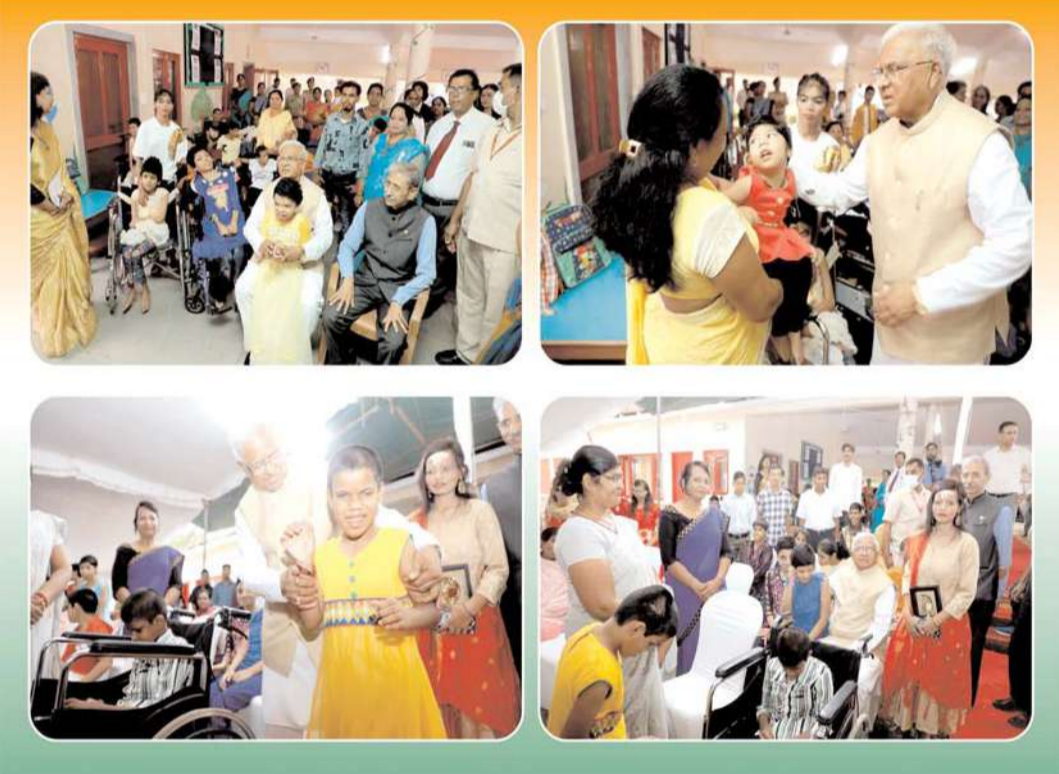
राज्यपाल श्री मंगुभाई पटेल ने एसओएस बालग्राम पहुंच कर दिव्यांग बच्चों को आत्मीयता का अहसास कराया।

भोपाल। राजधानी भोपाल के अखिल भारतीय आयुर्विज्ञान संस्थान (एम्स) भोपाल के डायरेक्टर की नियुक्ति डेप्युटेशन के आधार पर की गई है। वे फिलहाल नोएडा के पोस्ट ग्रेजुएट इंस्टीट्यूट ऑफ चाइल्ड हेल्थ में डायरेक्टर हैं। डॉ. अजय सिंह ने लखनऊ की किंग जॉर्ज मेडिकल यूनिवर्सिटी से एमबीबीएस और एमएस करने के बाद वे चब्रू में ही पीडियाट्रिक्स ऑर्थोपेडिक्स डिपार्टमेंट के एचओडी रह चुके हैं। अब उन्हें एम्स भोपाल का डायरेक्टर बनाया गया है। केन्द्र सरकार ने इस संबंध में आदेश जारी किए हैं। सात महीने बाद मिले फुलटाइम डायरेक्टर:- एम्स भोपाल के डायरेक्टर से डॉ.सरमन सिंह का कार्यकाल 8 नवंबर को खत्म हो गया था। डॉ.सरमन सिंह के रिटायरमेंट के बाद एम्स रायपुर के डायरेक्टर डॉ.नितिन नागरकर को भोपाल एम्स का भी प्रभार दिया गया था। अब केन्द्र सरकार ने करीब सात महीने बाद डॉ.अजय सिंह को डेप्युटेशन पर 30 जून 2028 तक के लिए नियुक्त किया है। नए DDA ने भी किया ज्वाइन एम्स भोपाल में नए उपनिदेशक (प्रशासन) की भी नियुक्ति हुई है। करीब एक हफ्ते पहले भारतीय सेना के अधिकारी कर्नल अजीत कुमार को नया डिप्टी डायरेक्टर (एडमिन) बनाकर भेजा है। डीडीए डॉ.श्रमदीप सिन्हा का कार्यकाल खत्म होने के बाद प्रतिनियुक्ति पर कर्नल अजीत कुमार की नियुक्ति हुई है।