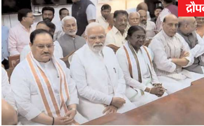
द्रौपदी के समर्थन में आए जगन

मुर्मू ने विपक्षी नेताओं को फोन कर मांगा समर्थन:- द्रौपदी मुर्मू ने शुरुआत को कांग्रेस प्रमुख सोनिया गांधी,