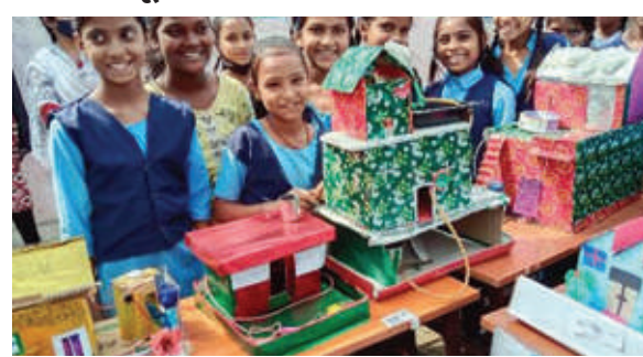
समर्थ सहारा, दमोह