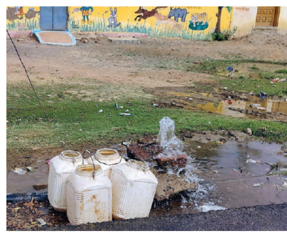
समर्थ सहारा, दमोह

दमोह जिले के पटेरा तहसील में नल जल योजना के माध्यम से लोगों को पानी तो उपलब्ध हो रहा है पर कहीं कहीं नल की टोंटी नदारत है तो अधिकांश जगह नल की टोंटी में लॉक सिस्टम न होने के कारण लोगों ने प्लास्टिक की बोतल और लकड़ी के टुकड़ों से बंद कर दिया है आश्चर्य तो यह कि नगर