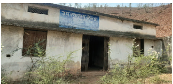
समर्थ सहारा, दमोह

दमोह जिले के ग्रामीण अंचलों में स्वास्थ्य विभाग के द्वारा सुविधाएं तो मुहैया करवाई जाती रही है पर अभी भी कुछ ग्राम स्वास्थ्य सुविधाओं से लाभान्वित होने का इंतजार कर रहे हैं। जिले के पटेरा तहसील के ग्राम तिरगढ़ (बिलगुवा) में वर्षों पहले उपस्वास्थ्य केंद्र बनकर तैयार हो चुका था पर अब तक वहाँ कोई नहीं पहुंचा, यहां के हालात अब यह है कि देखरेख का अभाव होने के कारण अब भवन को मरम्मत की आवश्यकता भी है इस भवन