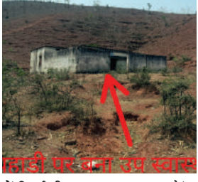
पटेरा तहसील के ग्राम तिरगढ़ (बिलगुवा) में वर्षों पहले उपस्वास्थ्य केंद्र बनकर तैयार हो चुका था पर अब तक वहाँ कोई नहीं पहुंचा, यहां के हालात अब यह है कि देखरेख का अभाव होने के कारण अब भवन को मरम्मत की आवश्यकता भी है इस भवन

दमोह जिले के ग्रामीण अंचलों में स्वास्थ्य विभाग के द्वारा सुविधाएं तो मुहैया करवाई जाती रही है पर अभी भी कुछ ग्राम स्वास्थ्य सुविधाओं से लाभान्वित होने का इंतजार कर रहे हैं। जिले के पटेरा तहसील के ग्राम तिरगढ़ (बिलगुवा) में वर्षों पहले उपस्वास्थ्य केंद्र बनकर तैयार हो चुका था पर अब तक वहाँ कोई नहीं पहुंचा, यहां के हालात अब यह है कि देखरेख का अभाव होने के कारण अब भवन को मरम्मत की आवश्यकता भी है इस भवन