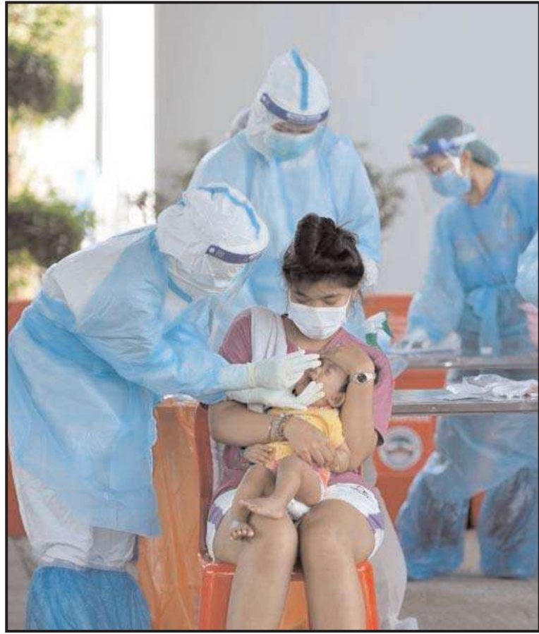
बैकाम में चिकित्सा कर्मी कोविड-19 जांच के लिए लोगों से नमूने लेते हुए।

यात्रियों और आम लोगों को भेजने की योजना बना रही है। इसके लिए प्रारंभिक तौर पर अंतरराष्ट्रीय अंतरिक्ष मिशन में इस्तेमाल होने वाले खाने का ही उपयोग किया जाएगा। लेकिन समय के साथ चंद्रमा पर ऐसे खाने की बार-बार आपूर्ति करने की जरूरतें बढ़ेंगी। इसके लिए कोई ऐसी खाद्य सामग्री चाहिए, जो एक बार बनाने के बाद लंबे समय तक अंतरिक्ष यात्रियों का पेट भर सके। ऐसे में धरती से बार-बार रॉकेट से सामान भेजने की आवश्यकता नहीं होगी। नासा के अंतरिक्ष प्रौद्योगिकी मिशन निदेशालय के सहयोगी प्रशासक जिम रेडर ने कहा कि खाद्य प्रौद्योगिकी की सीमाओं को आगे बढ़ाने से भविष्य के खोजकर्ता स्वस्थ रहेंगे और यहां तक कि घर पर लोगों को खिलाने में भी मदद मिल सकती है।