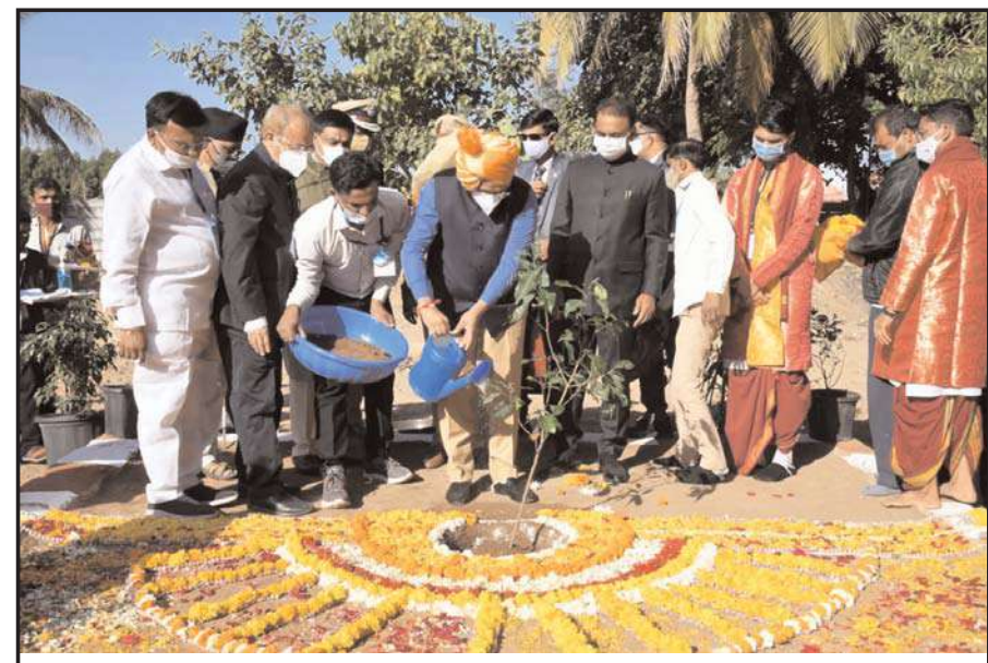
(अहमदाबाद) गिर सोमनाथ जिले में 11 लाख पेड़ लगाने के सोमनाथ ट्रस्ट के संकल्प में सहभागी बने मुख्यमंत्री

नई दिल्ली। कोरोना के ओमीक्रोन से संक्रमित व्यक्ति में प्रभावी प्रतिरोधक क्षमता विकसित हो जाती है, जो ना केवल ओमीक्रोन बल्कि डेल्टा के अन्य प्रकारों को भी बेअसर कर सकती है। यह बात आईसीएमआर की ओर से किए गए एक अध्ययन में कही गई है। अध्ययन रिपोर्ट में बताया गया है कि ओमीक्रोन जनित प्रतिरोधक क्षमता वायरस के डेल्टा प्रकार को बेअसर कर सकती है। इससे डेल्टा से दोबारा संक्रमित होने की आशंका बहुत कम हो जाती है। इससे संक्रमण फैलाने के लिहाज से डेल्टा का प्रभुत्व खत्म हो जाएगा। हालांकि रिपोर्ट में ओमीक्रोन को लक्ष्य करके टीका बनाने पर जोर दिया गया है। यह अध्ययन कुल 39 लोगों पर किया गया जिनमें से 25 लोगों ने एस्ट्रोजेनिका के कोरोनारोधी टीके की दोनों खुराक ली थी, जबकि आठ लोगों ने फाइजर के टीके की दोनों खुराक ली थी और छह ने कोई कोरोना रोधी टीका नहीं लगाया था। इसके अलावा 39 में से 28 लोग यूआई, अफ्रीकी देशों, मध्य एशिया, अमेरिका और ब्रिटेन से लौटे थे, जबकि 11 लोग उच्च जोखिम युक्त संपर्क में थे। ये सभी लोग ओमीक्रोन से संक्रमित थे। अध्ययन में मूल कोरोना से दोबारा संक्रमण पर आईजीजी एंटीबॉडी और न्यूट्रलाइजिंग एंटीबॉडी (एनएबी) प्रतिक्रिया का अध्ययन किया गया।