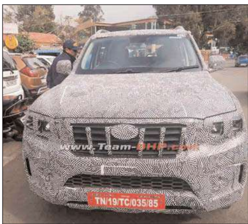
जा सकता है और आपको बता दें कि इस बारे में

नई दिल्ली । स्वदेशी कंपनी महिंद्रा की स्कोर्पियो कार भारत की सबसे पॉपुलर एसयूवी कारों में शामिल है महिंद्रा की इस बेहद लोकप्रिय कार में पहले से ज्यादा दमदार डिजाइन,मॉडर्न इंटीरियर और पावरफुल पेट्रोल और डीजल इंजन के विकल्प मिलने वाले हैं। नई 2022 महिंद्रा स्कोर्पियो 2 2.0 लीटर टर्बो पेट्रोल और 2.2 लीटर डीजल इंजन की चॉइस दी जा सकती है।