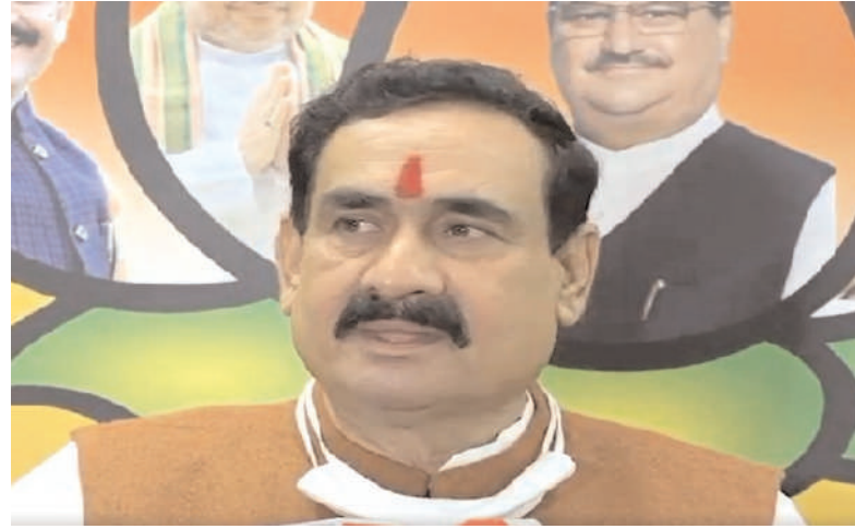
गाढ़ी कमाई पर मुफ्त में पढ़ाई कराने वाला का अड्डा बन गया है। अब इस पर गंभीरता से विचार किया जाना चाहिए।

आईटीडीसी इंडिया ई-प्रेस/ आईटीडीसी न्यूज भोपाल गृहमंत्री नरोत्तम मिश्रा ने प्रेस कॉन्फ्रेंस में कहा कि मध्य प्रदेश में फिल्मों की शूटिंग को लेकर गृह विभाग ने गाइडलाइन तैयार कर ली है और इसे जल्द ही जारी कर दिया जाएगा। अब कलेक्टर से अनुमति लेने के बाद ही शूटिंग की जा सकेगी। कोरोना को लेकर सरकार पूरी तरह अलर्ट है और पूरी कोशिश है कि तीसरी लहर को नहीं आने दे। मध्य प्रदेश में पिछले 24 घंटे में कोरोना के 16 नए केस आए हैं, जबकि 13 लोग स्वस्थ हुए हैं। वर्तमान में प्रदेश में कोरोना के कुल एक्टिव केस 140 और रिकवरी रेट 98.60 फीसदी है। गृहमंत्री ने कहा कि टुकड़े-टुकड़े गैंग देश में फिर से माहौल बिगाड़ने की कोशिश कर रहा है और जेएनयू में देश? विरोधी नारे इसी क्रोनोलाजी के तहत लगे हैं। जनता की