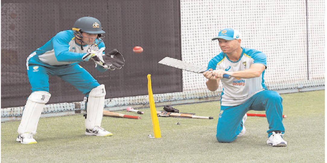
ऑस्ट्रेलिया के नए विकेटकीपर एलेक्स कैरी, ऑस्ट्रेलिया के ब्रिस्बेन में पहले एशेज क्रिकेट टेस्ट से पहले गाबा में अपने प्रशिक्षण सत्र के दौरान डेविड वार्नर की बल्लेबाजी के साथ गेंद को पकड़ते हैं।

साउथ अफ्रीका में रहाणे का रहा है शानदार प्रदर्शन रहाणे ने साउथ अफ्रीका में 3 टेस्ट मैच खेले हैं। इस दौरान इस खिलाड़ी के बल्ले से 266 रन निकले हैं। उनका औसत 53.20 का है। 3 टेस्ट में इस खिलाड़ी ने दो अर्धशतक जड़े हैं। उनका सर्वाधिक स्कोर 96 रन है। अगर ओवरऑल साउथ अफ्रीका के खिलाफ रहाणे का प्रदर्शन देखें तो वो भी कमाल का है। रहाणे ने साउथ अफ्रीका के खिलाफ 10 टेस्ट मैच में 57.33 के औसत से 748 रन बनाए हैं। इन मैचों में रहाणे के बल्ले से 3 शतक और 3 अर्धशतक निकले हैं। अजिंक्य रहाणे ने भारतीय सरजमीं पर 32 टेस्ट मैच खेले हैं।