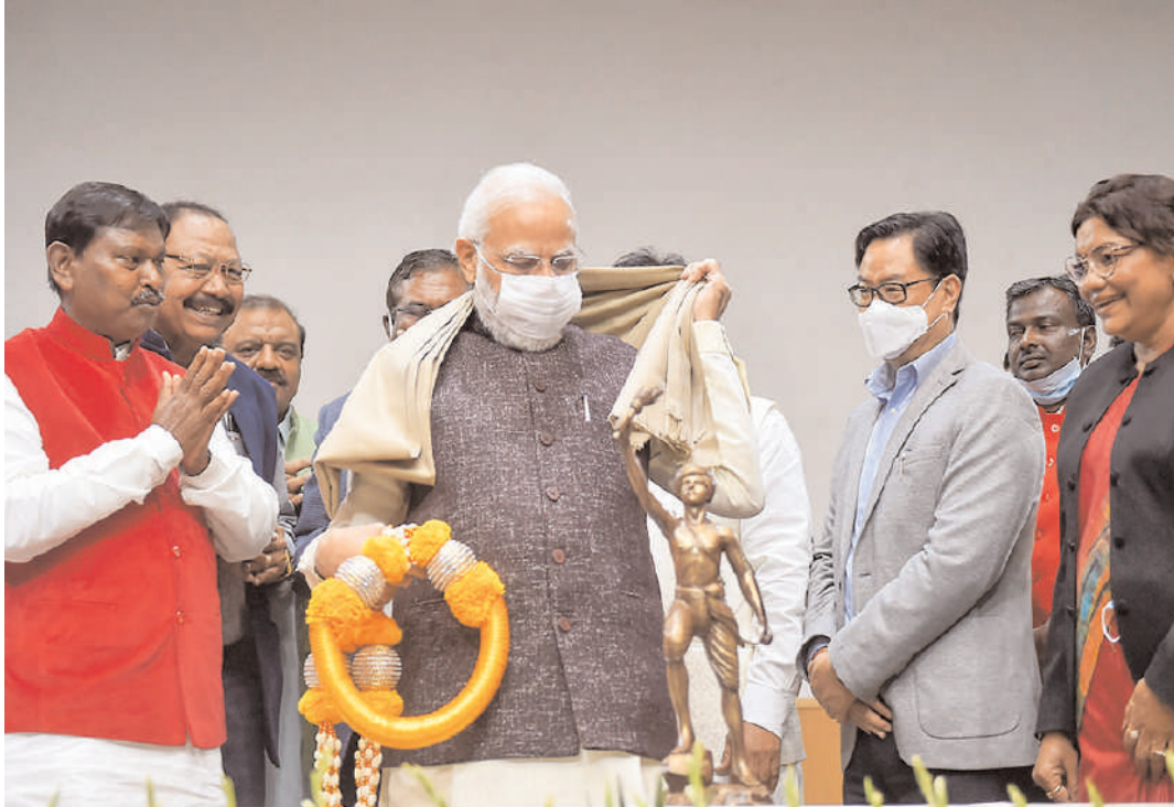
नई दिल्ली में अंडेडकर इंटरनेशनल सेंटर में भाजपा संसदीय दल की बैठक के दौरान 15 नवंबर को %जनजातीय गौरव दिवस% के रूप में घोषित किए जाने के बाद प्रधानमंत्री नरेंद्र मोदी का अभिनंदन किया गया।

सारा गिल्बर्ट ऑक्सफोर्ड यूनिवर्सिटी की वैक्सीनोलॉजी डिपार्टमेंट की प्रोफेसर हैं। ऑक्सफोर्ड-एस्ट्रोजेनेका वैक्सीन बनाने वाले ग्रुप की एक मेंबर भी रही हैं। उन्होंने कहा कि यह आखिरी बार नहीं है जब कोई वायरस हमारे जीवन के लिए खतरा बना है। सच्चाई यह है कि आने वाला समय और भी बदतर हो सकता है। ब्रिटेन में एक दिन में 50 फीसदी से ज्यादा बढ़ी नए पीड़ितों की संख्या ब्रिटेन में रविवार को ओमिक्रॉन के 86 नए केस मिले। चूंकि अब कुल पीड़ितों की संख्या 246 हो गई है। शनिवार तक यहां 160 केस थे, यानी एक दिन में ओमिक्रॉन के मामलों में 50 फीसदी से ज्यादा की बढ़ोतरी हुई है। बीते दिन चूंकि कांविड-19 के 43,992 नए केस मिले। यहां अब तक 1.04 करोड़ लोग संक्रमित हो चुके हैं।