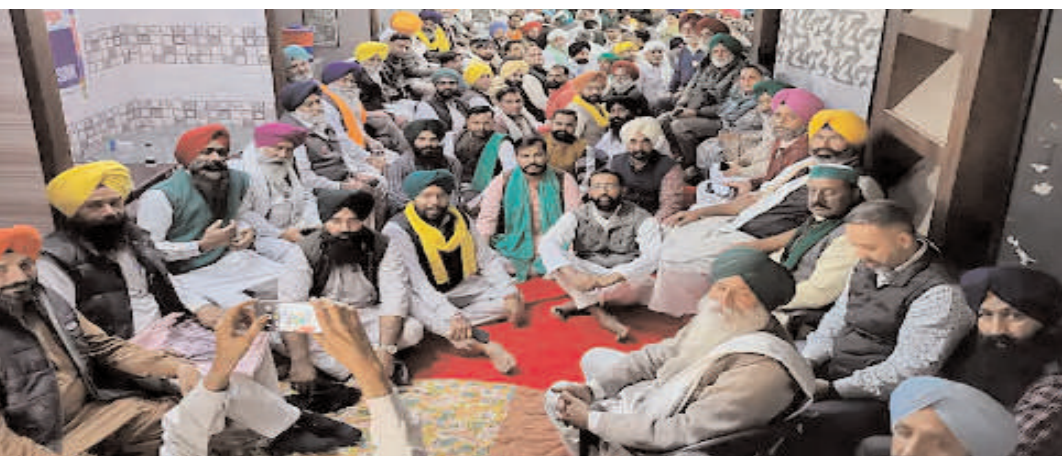
संयुक्त किसान मोर्चा की अहम बैठक दिल्ली-हरियाणा के सिन्धु बॉर्डर पर कजारिया कार्यालय में जारी है। इस बैठक में देशभर के किसान संगठनों के नेता शामिल हैं। सरकार द्वारा अभी तक किसानों की पांच सदस्य कमेटी से कोई संपर्क नहीं किए जाने के कारण यह मीटिंग बुलाई गई है।

आईटीडीसी इंडिया ई-प्रेस/ आईटीडीसी न्यूज नई दिल्ली इंडियन मेडिकल एसोसिएशन ने ओमिक्रॉन के बढ़ते मामलों को लेकर चिंता जाहिर की है। IMA ने सरकार से मांग की है कि कोरोना वॉरियर्स के लिए वैकसीन की अरिक्त डोज मुहैया कराई जाए। देश में ओमिक्रॉन के अब तक 21 केस मिल चुके हैं। IMA ने कहा कि ओमिक्रॉन की संक्रमण दर काफी तेज है। समय रहते जरूरी कदम उठाने होंगे, नहीं तो कोरोना की खतरनाक तीसरी लहर आ सकती है। ओमिक्रॉन संक्रमित मिले बेंगलूर के डॉक्टर का कोरोना टेस्ट फिर से पॉजिटिव आया है। डॉक्टर में संक्रमण की पुष्टि होने के सात दिन बाद दोबारा RT-PCR टेस्ट हुआ। अब सात दिन तक और उसे निगरानी में रखा जाएगा। इसके बाद एक बार फिर से उनको कोरोना जांच है। RT-PCR टेस्ट रिपोर्ट निगेटिव आने पर ही उसे डिस्चार्ज किया जाएगा। मालूम हो कि कर्नाटक में ही देश के पहले दो ओमिक्रॉन केस मिले थे। मध्य प्रदेश में कोरोना के केस लगातार बढ़ रहे हैं। 24 घंटे में 16 नए पॉजिटिव मिले हैं। 10 दिन बाद इंदौर में सबसे ज्यादा 8 कोरोना केस आए हैं।