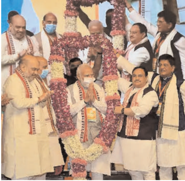
100 करोड़ कोरोना टीकाकरण को उपलब्धि पर बैठक में पीएम मोदी को भाजपा अध्यक्ष जेपी नड्डा और पार्टी के पूर्व राष्ट्रीय अध्यक्षों ने सम्मानित किया।

आईटीडीसी इंडिया ई-प्रेस/ आईटीडीसी न्यूज नई दिल्ली भारतीय जनता पार्टी की राष्ट्रीय कार्यकारिणी की बैठक दिल्ली स्थित ह्यूस्ट्र कन्वेंशन सेंटर में चल रही है। बैठक में प्रधानमंत्री नरेंद्र मोदी, गृह मंत्री अमित शाह और पार्टी अध्यक्ष जेपी नड्डा समेत सभी बड़े नेता शामिल हैं। बैठक के दौरान पार्टी अध्यक्ष जेपी नड्डा ने प्रधानमंत्री मोदी की तारीफ की। उन्होंने कहा कि ऋतू मोदी ने महामारी के बीच बोल्ट स्टेप लिए, जिससे अर्थव्यवस्था को फायदा पहुंचा। राष्ट्रीय कार्यकारिणी समिति के उद्घाटन भाषण में नड्डा ने कहा कि लॉकडाउन जैसा कड़ा फैसला मोदी ने लिया और लॉकडाउन के तीन महिने के भीतर लोगों को सभी ज़रूरी सुविधाएं उपलब्ध कराई गईं। उन्होंने कहा