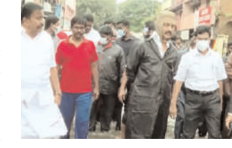
चलकर लोगों के पास पहुंचे। 10 घंटे में 14 सेमी बारिश रिकॉर्ड की गई शनिवार रात से रविवार दोपहर 1 बजे तक चेन्नई में 14 सेमी बारिश रिकॉर्ड की गई है।

आईटीडीसी इंडिया ई-प्रेस/ आईटीडीसी न्यूज चेन्नई चेन्नई में शनिवार सुबह से हो रही बारिश के चलते बाढ़ जैसे हालात बन गए हैं। 2015 के बाद शहर में पहली बार इतनी अधिक बारिश हुई है। कई इलाकों में सड़कों और घरों के अंदर पानी भर गया है। प्रशासन ने रविवार को बाढ़ की चेतावनी जारी कर दी है। तमिलनाडु के मुख्यमंत्री एम.के. स्टालिन बाढ़ प्रभावित इलाकों के दौरे पर हैं। वे पानी में डूबी सड़कों पर ही