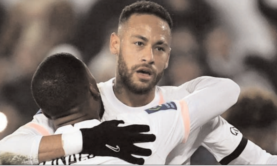
पेरिसस्तर खिलाड़ी नेमार के दो गोल की बदौलत शीर्ष पर चल रहे पेरिस सेंट जर्मेन (पीएसजी) ने फ्रांस फुटबॉल लीग में बोरडोक्स पर 3-2 की जीत दर्ज की। नेमार (26वें और 43वें मिनट) के दो गोल के अलावा काइलियान एमबापे (63वें मिनट) ने भी एक गोल किया जिससे पीएसजी ने 63वें मिनट के बाद 3-0 की बढ़त बना ली थी।

उन्हें मैदान से बाहर ले जाना पड़ा। मैच के बाद जेसन रॉय को एक सपोर्टर की मदद से चलते हुए देखा गया। टारगेट का पीछा करते हुए इंग्लैंड की शुरुआत धमाकेदार रही। जेसन रॉय और बटलर ने इंग्लैंड को जोरदार शुरुआत दिलाई। मैच में क्या हुआ? मैच की बात करें तो साउथ अफ्रीका ने सुपर-12 के मैच में इंग्लैंड को 10 रनों से हरा दिया। टॉस हारकर पहले साउथ अफ्रीका ने अच्छी बल्लेबाजी की और 2 विकेट के नुकसान पर 189 रनों का स्कोर बनाया। रैसी वान डेर डुसेन ने 94* टॉप स्कोरर रहे, जबकि एडेन मार्करम ने भी 52 रनों की नाबाद पारी खेली। 190 रनों के टारगेट का पीछा करते हुए इंग्लैंड 179/8 का स्कोर ही बना सका और हार गई।