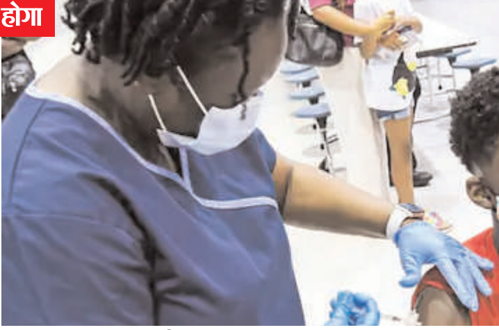
कनाडा स्वास्थ्य विभाग ने क्या गाइडलाइंस जारी कीं

आईटीडीसी इंडिया ई-प्रेस/आईटीडीसी न्यूज ओटावा कनाडा ने कोरोना से बच्चों को सुरक्षित रखने के लिए बड़ा फैसला लिया है। यहां 5-11 साल के बच्चों को फाइजर कोरोना वैक्सीन की 2 डोज लगाने की मंजूरी दे दी गई है। यह फैसला तब लिया गया, जब कुछ कंपनियों ने इस एज ग्रुप के हजारों बच्चों के क्लिनिकल ट्रायल के लिए एप्लिकेशन भेजी। नतीजों में सामने आया कि 16 से 25 साल के एज ग्रुप में वैक्सीन का जो प्रभाव था, वही 5 से 11 साल के एज ग्रुप में भी दिखा। कनाडा स्वास्थ्य विभाग के एक अधिकारी ने कहा, ट्रायल के स्वतंत्र रिजल्ट करने के बाद हम बच्चों को भी वैक्सीन का लाभ देना चाहते हैं। 5 से 11 साल के बच्चों में भी यह वैक्सीन 90% प्रभावी पाई गई है। इसके अलावा इसके कोई गंभीर साइड इफेक्ट भी नहीं दिखाई दिए हैं। अभी तक इस एज ग्रुप में सुरक्षा संबंधी कोई समस्या सामने नहीं आई है और इस पर लगातार नजर रखी जाएगी।