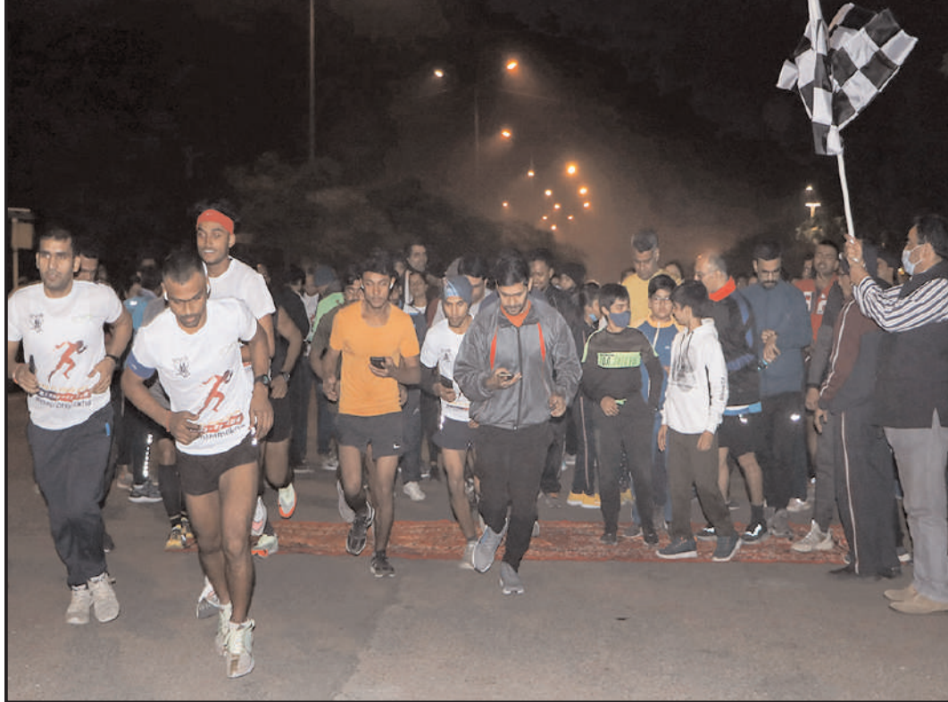
गुरुग्राम में स्वर्गीय मिल्खा सिंह की जयंती पर पलाइंग सिख मिडनाइट रन में भाग लेते लोग