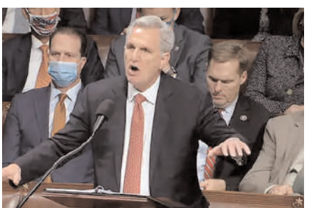
उन्हें इस तरह का बिल पास करने से पहले वॉरिंग देना चाहते हैं। कुछ सुझाव हैं, उन्हें मान लेना चाहिए। बाइडेन की डेमोक्रेटिक पार्टी सत्ता में है और डोनाल्ड ट्रम्प की रिपब्लिकन पार्टी विपक्ष में। डेमोक्रेटिक सांसद चाहते थे कि बिल पर जल्द बहस पूरी की जाए और वोटिंग हो जाए, लेकिन केविन ने ऐसा होने नहीं दिया। लंबे भाषण के लिए सोशल मीडिया पर केविन और रिपब्लिकन्स की आलोचना भी हो रही है। सत्ता पक्ष के नेता स्टेने होयर ने संसद की कार्रवाई शुरू होने पर कहा- हम जल्द ही इस बिल पर वोटिंग करेंगे।

आईटीडीसी इंडिया ई-प्रेस/आईटीडीसी न्यूज वाशिंगटन अमेरिकी संसद के निचले सदन हाउस ऑफ रिप्रेजेंटेटिव्स में गुरुवार को राष्ट्रपति जो बाइडेन के 'बिल्ड बैक बैटर' बिल पर वोटिंग नहीं हो सकी। इसका बजट 1850 अरब डॉलर है। बिल पर वोटिंग न हो पाने की वजह बना अमेरिकी सीनेट के अंदर आज तक के रिकॉर्ड तोड़ने वाला सबसे लंबा भाषण। करीब 8 घंटे 32 मिनट का यह भाषण रिपब्लिकन सीनेटर केविन मैकार्थी ने दिया। केविन सीनेट की मौजूदा हाउस स्पीकर नेंसी पेलेोसी का रिकॉर्ड तोड़ा, जिन्होंने 2018 में 8 घंटे 7 मिनट लंबी स्पीच दी थी। खास बात यह है कि हाउस स्पीकर नेंसी पेलेोसी चाहती थीं कि इस बिल पर वोटिंग हो जाए, लेकिन केविन ने भाषण का वक्त कम करने से इनकार कर दिया। लिहाजा, वोटिंग अटक गई। फालतू खर्च रोकना चाहता हूं