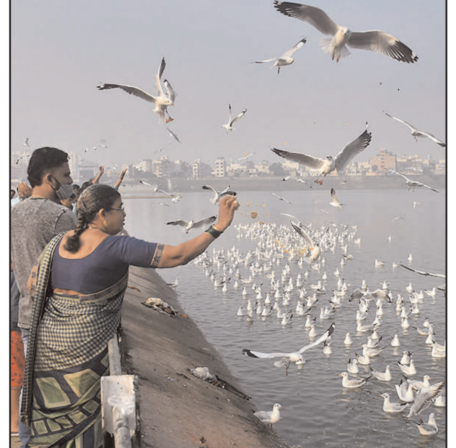
लोग सूरत में आगा नदी के ऊपर उड़ने वाले साइबेरियन सीगल के झुंड को खाना खिलाते हैं।