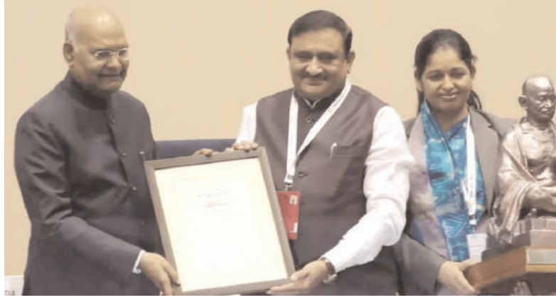
राष्ट्रपति श्री राम नाथ कोविंद से नगरीय विकास एवं आवास मंत्री श्री भूपेंद्र सिंह और राज्य मंत्री श्री ओ.पी. एस. भदोरिया ने पुरस्कार प्राप्त किया।

आईटीडीसी इंडिया ई-प्रेस/आईटीडीसी न्यूज भोपाल स्वच्छ सर्वेक्षण-2021 में मध्यप्रदेश के इंदौर शहर का एक बार फिर उका बजा है। इंदौर 5वीं बार भी देशभर में अक्ल आया है। वर्ष 2017 से इंदौर देशभर में नंबर-1 पर आ रहा है। इस बार इंदौर ने सफाई का पंच लगा दिया। सफाई मित्र सुरक्षा चैलेंज में भी इंदौर अक्ल रहा। इसमें 12 करोड़ रुपए का पुरस्कार मिला। राज्य कैटेगरी में मध्यप्रदेश को तीसरा स्थान मिला है। मध्यप्रदेश को कुल 35 अवाइड मिले हैं। इंदौर के पांचवीं पर टॉप रहने पर मध्यप्रदेश के मुख्यमंत्री शिवराज सिंह चौहान का इंदौर अंदाज दिखा। उन्होंने ट्वीट किया- वाह भिया! छा गया अपना इंदौर... दस लाख से ज्यादा आबादी वाले टॉप 20 शहरों में मद्र के चारों बड़े शहर शामिल हैं। इंदौर-, भोपाल-7 ग्वालियर- 15 जबलपुर-20 नंबर पर है। 10 लाख तक की आबादी में उज्जैन का पांचवा नंबर है। वहीं तीन लाख की