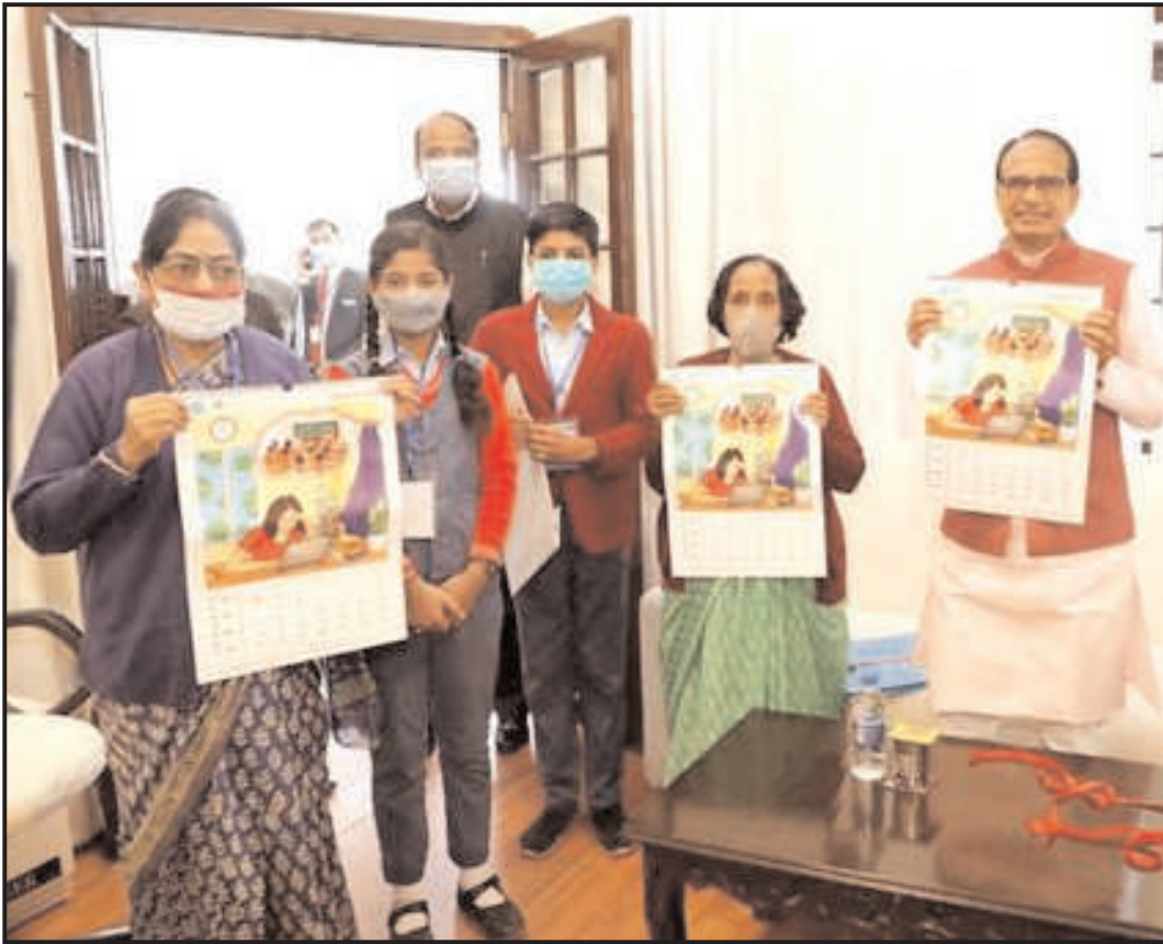
मुख्यमंत्री श्री शिवराज सिंह चौहान ने चाइल्ड राइट्स ऑब्जर्वेटरी म.प्र. के कैलेंडर का लोकार्पण किया।

भोपाल। भारत सरकार के जल-शक्ति मंत्रालय द्वारा राष्ट्रीय जल जीवन मिशन में मध्यप्रदेश को सेकंड ट्रेन्च में 1279 करोड़ 19 लाख रुपये आवंटित किए हैं। उल्लेखनीय है कि कार्य की प्रगति और धनराशि के उपयोग के आधार पर वित्तीय वर्ष 2021-22 में सेकंड ट्रेन्च में अनुदान प्राप्त करने वाला मध्यप्रदेश पहला राज्य है। देश के अन्य किसी राज्य को अभी तक जल जीवन मिशन में सेकंड ट्रेन्च राशि आवंटित नहीं हुई है। मई 2021 में प्राप्त फर्स्ट ट्रेन्च की राशि और राज्य सरकार द्वारा समान अंशदान समिन्तित कर मिशन के कार्यों का संचालन किया जा रहा है। मध्यप्रदेश ने फर्स्ट ट्रेन्च और राज्य सरकार के समान अंशदान की 80 प्रतिशत राशि व्यय किए जाने के फलस्वरूप केन्द्र सरकार से सेकंड ट्रेन्च में राशि उपलब्ध हुई है। ग्रामीण आबादी के हर परिवार को नल कनेक्शन के माध्यम से जल उपलब्ध कराने के कार्य जल जीवन मिशन में किए जा रहे हैं।