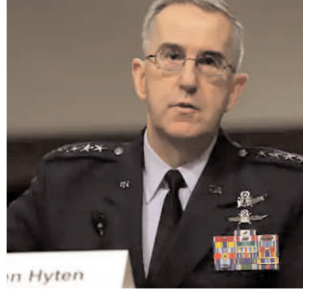
परीक्षण से साफ इनकार किया है। चीन मिसाइल रखने के नए टिकाने बनाने में जुटा है हाइटेन ने कहा कि चीन अपनी युद्ध क्षमताओं और मिसाइल रखने के लिए लगातार नए टिकाने बना रहा है। वह अपनी क्षमताओं को इतना बढ़ाने में सक्षम हो सकता है कि अमेरिका पर अचानक परमाणु हमला कर सके। चीन ने पिछले 5 साल में सैकड़ों हाइपरसोनिक परीक्षण किए जबकि अमेरिका ने केवल 9 परीक्षण किए हैं।

आईटीडीसी इंडिया ई-प्रेस/आईटीडीसी न्यूज वाशिंगटन चीन के साथ बढ़ते तनाव के बीच अमेरिका के जॉइंट चीफ ऑफ स्टॉफ के वाइस चेयरमैन जॉन हाइटेन ने कहा कि चीन द्वारा 27 जुलाई को लॉन्च की गई हाइपरसोनिक मिसाइल ने आवाज की गति से 5 गुना अधिक रफतार से दुनिया का चक्कर लगाया था। इसने एक हाइपरसोनिक ग्लाइड वाहन गिराया, जो अपने लक्ष्य को भेदने के लिए वापस चीन लौटा। उन्होंने चेतावनी दी है कि चीन अमेरिका पर कभी भी इस तरह की परमाणु मिसाइलों से हमला कर सकता है। सीबीएस न्यूज से बात करते हुए अमेरिकी सेना के दूसरे शीर्ष अधिकारी हाइटेन ने कहा, चीन की यह मिसाइल लक्ष्य के कुछ किलोमीटर से अपने निशाने को भेदने में चूक गई लेकिन यह पहली बार हुआ है जब किसी देश ने एक हाइपरसोनिक हथियार भेजा है। वहीं, चीन ने इस मिसाइल के