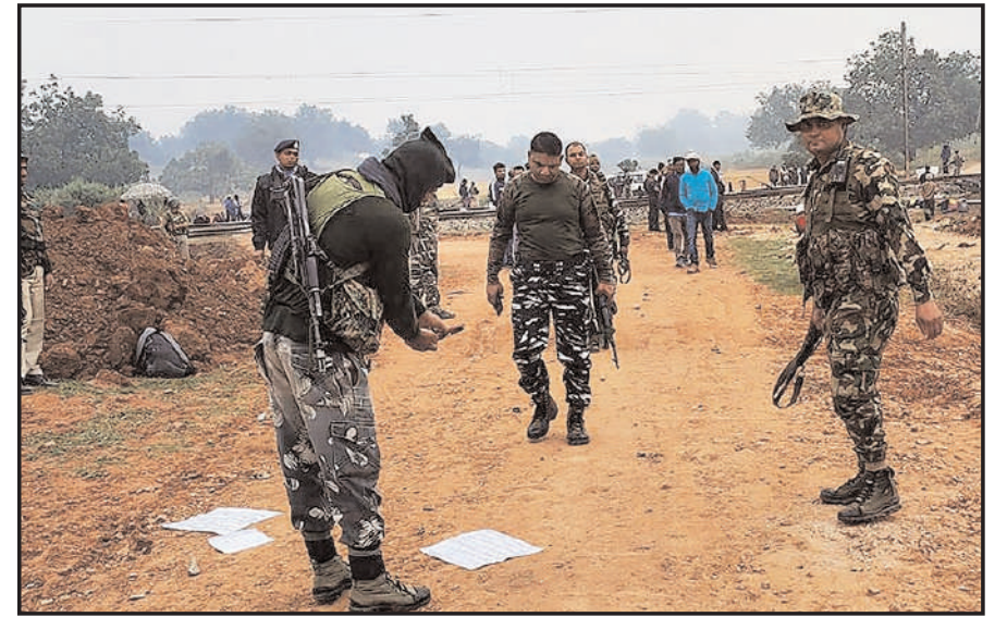
लातेहार जिले में तोरी-लातेहार रेल लाइन पर रिचुगुटा स्टेशन-डेमू स्टेशन के बीच भकप-मोइस्ट विट्रोहियों द्वारा एक रेलवे ट्रैक को उड़ा दिए जाने के बाद सुरक्षा बलों और दक्षिण पूर्व रेलवे (एसईआर) के अधिकारी घटनास्थल की जांच कर रहे हैं।

पोस्ट किया हो जिससे कि उसके क्राइम से जुड़े होने के बारे में संकेत मिले तो उसे संदिग्ध मान कर जांच की जाती है। सॉफ्टवेयर कंपनियों इसके लिए आर्टिफिशियल इंटेलिजेंस (एआई) और एल्गोरिदम का प्रमुख रूप से इस्तेमाल करती हैं। यूजर्स के प्राइवेट और पब्लिक चैट पर भी सर्विलांस की जाती है। लॉस एंजिल्स में बढ़ती अपराध की दर के कारण पुलिस ने ये तरीका अपनाया है।